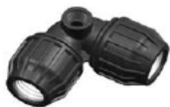
N° 332C CODO TOMA ASPERSOR