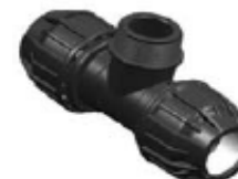
N° 333A TE MACHO