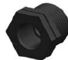
Nº 549 REDUCCION HEXAGONAL MH