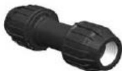
N° 331 B MANGUITO DE REPARACION