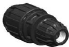
N° 331 A MANGUITO UNION REDUCIDO