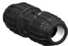
N° 331 MANGUITO UNION