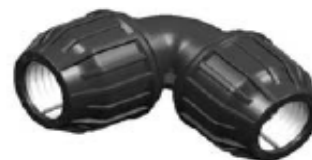
N° 332 CODO 90°