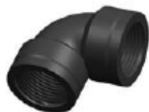
Nº 572 CODO 90º HH