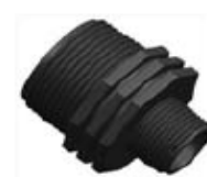
Nº 556B MACHON PP REDUCIDO