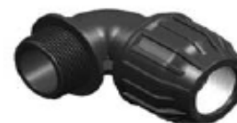
N° 332 A CODO 90° MACHO