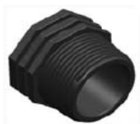
Nº 570 TAPON MACHO PP