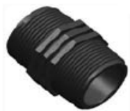
Nº 566 MACHON PP