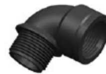
Nº 572B CODO 90º MH