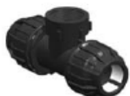
N° 333 TE HEMBRA