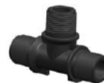
Nº 573 TE MMM