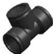
Nº 573A TE HHH