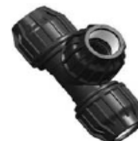
N° 334 TE