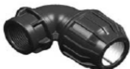
N° 332B CODO HEMBRA