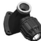
N° 332D CODO GRIFO